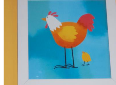
Ein langer Weg zur Adoption