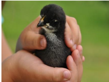
Werbung für IN-Betreuung und Familiäre Krisenbetreuung